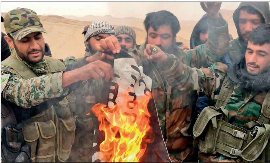
Народные ополченцы САР сжигают флаг ИГИЛ, снятый с отбитой у боевиков цитадели Пальмира.

Современное государство обязано защищать интересы каждого своего гражданина вне зависимости от его расы, национальности, принадлежности к определенной конфессии или религиозной традиции, в то время как ИГИЛ выражает интересы небольшой группы религиозных радикалов, жестоко подавляя остальную часть населения посредством запугивания, насилия и террора.